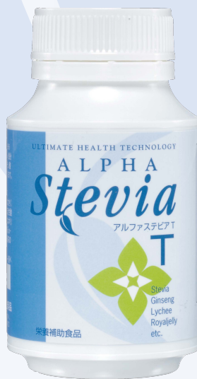
アルファステビア T (内容量75g [2.50mg X 300粒])