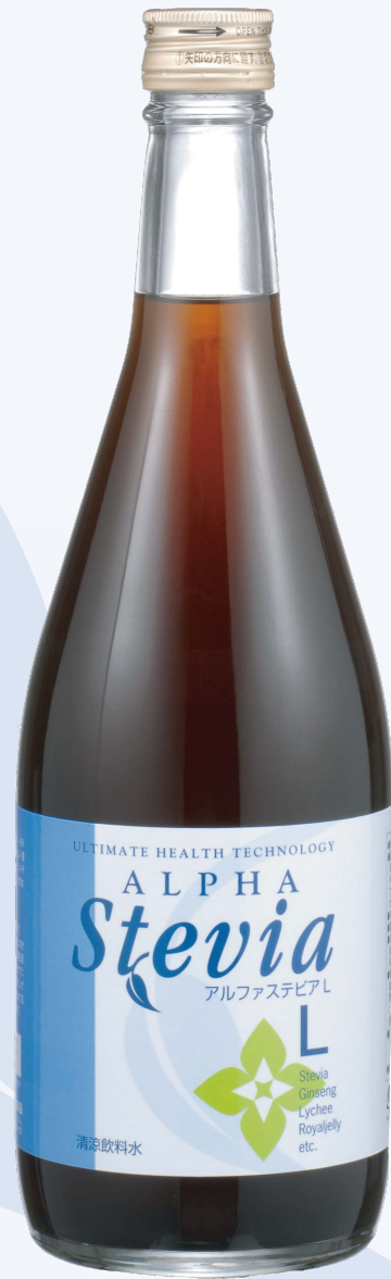
アルファステビア L (内容量720mL)